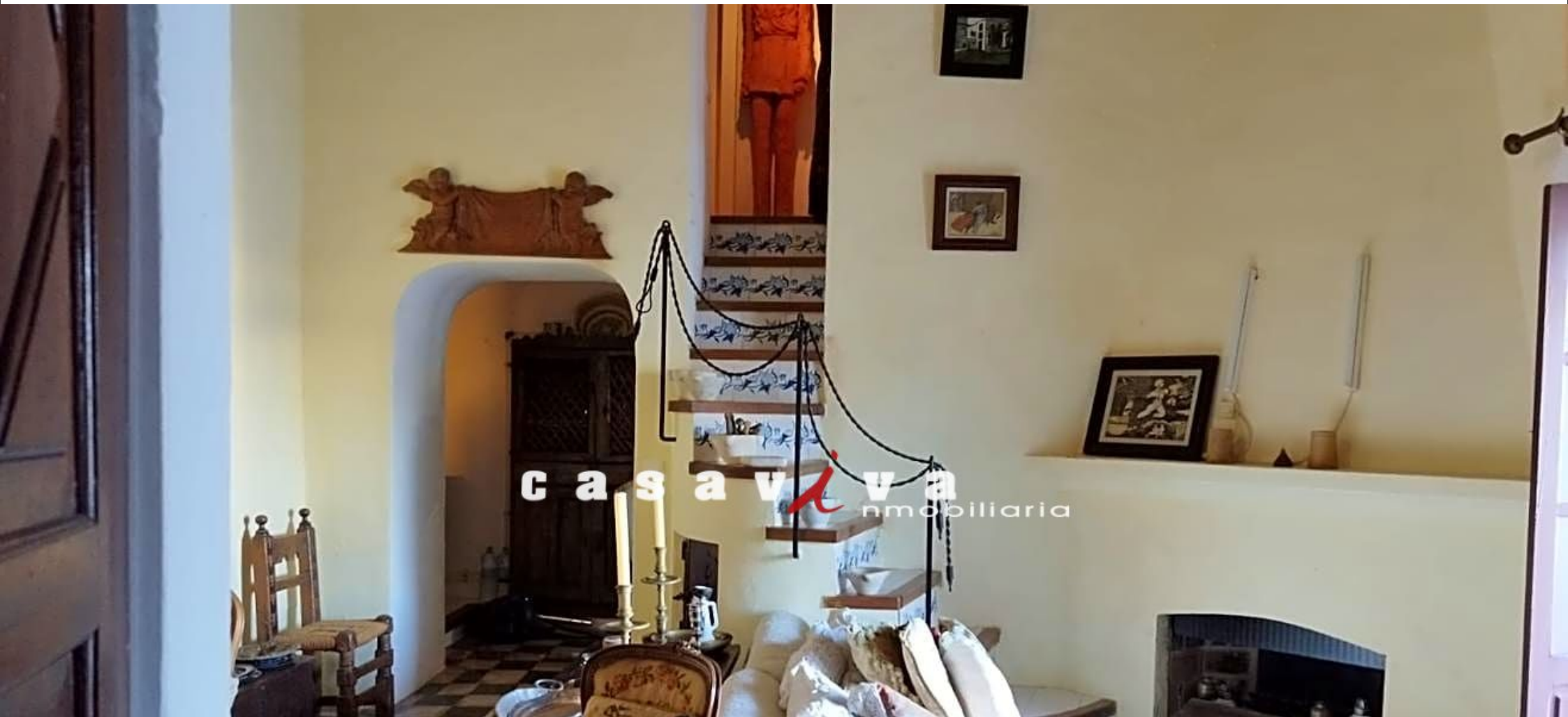
Piso histórico situado en Dalt Vila - Ibiza