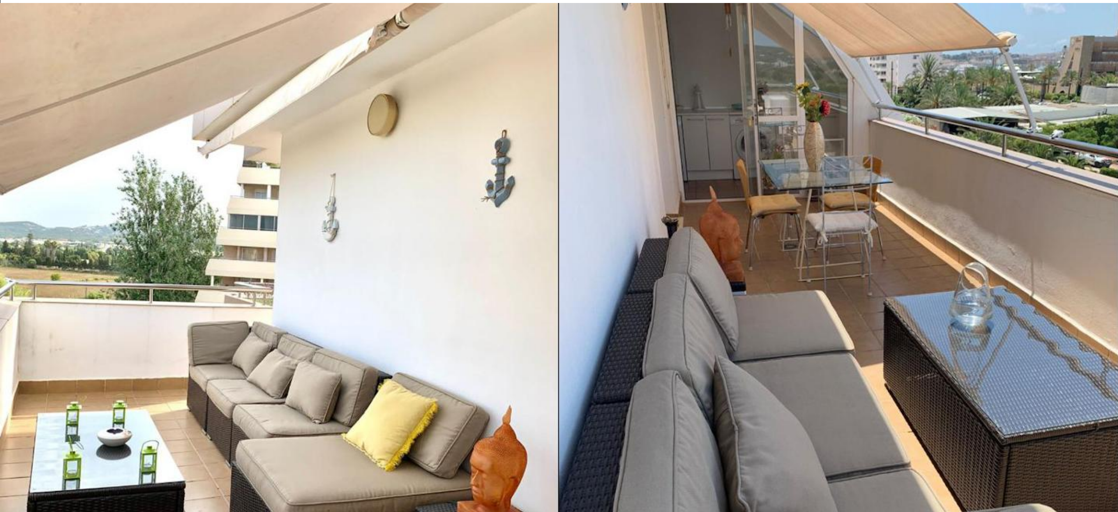
Piso con amplia terraza en Marina Botafoch - Ibiza