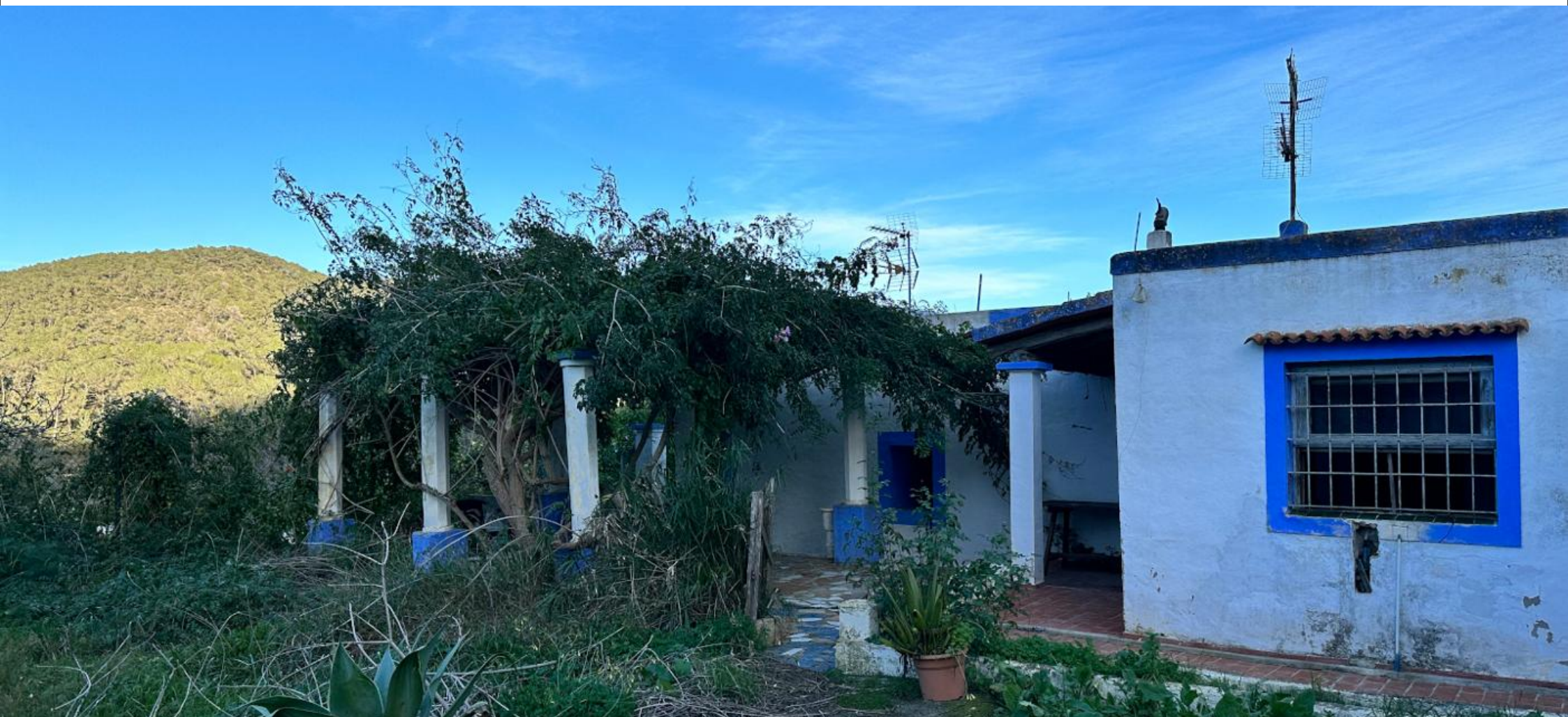
Casa de campo a reformar en San José - Ibiza