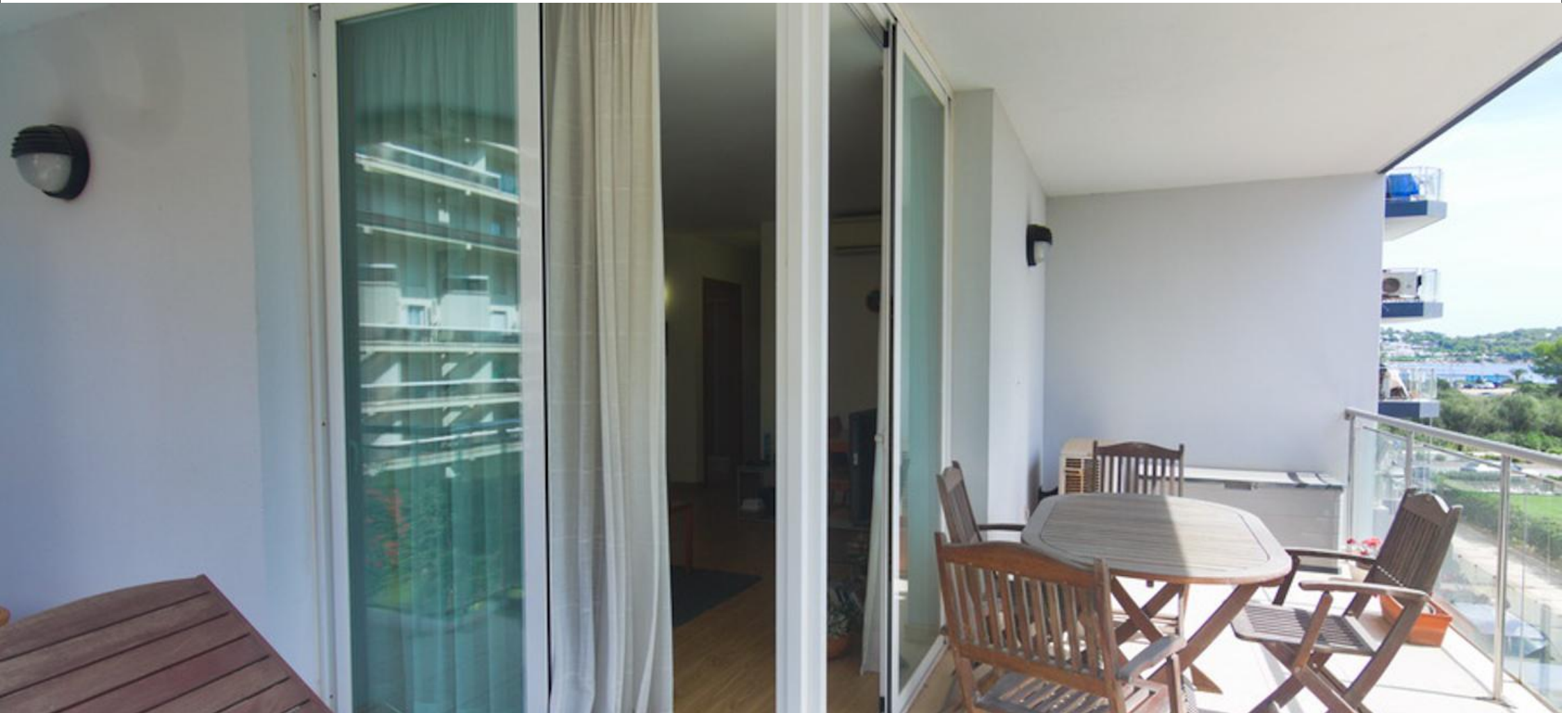
Piso reformado con terraza en Marina Botafoch - Ibiza