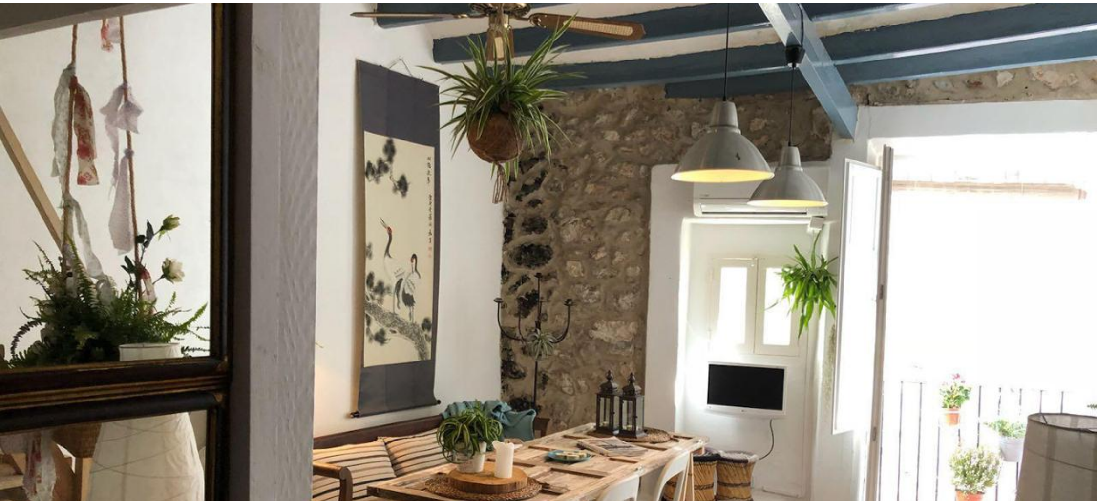
Encantador estudio reformado en el casco antiguo de Ibiza