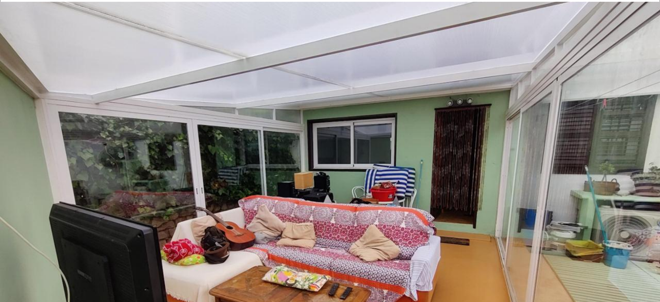
Planta baja con amplia terraza en Tamanca - Ibiza