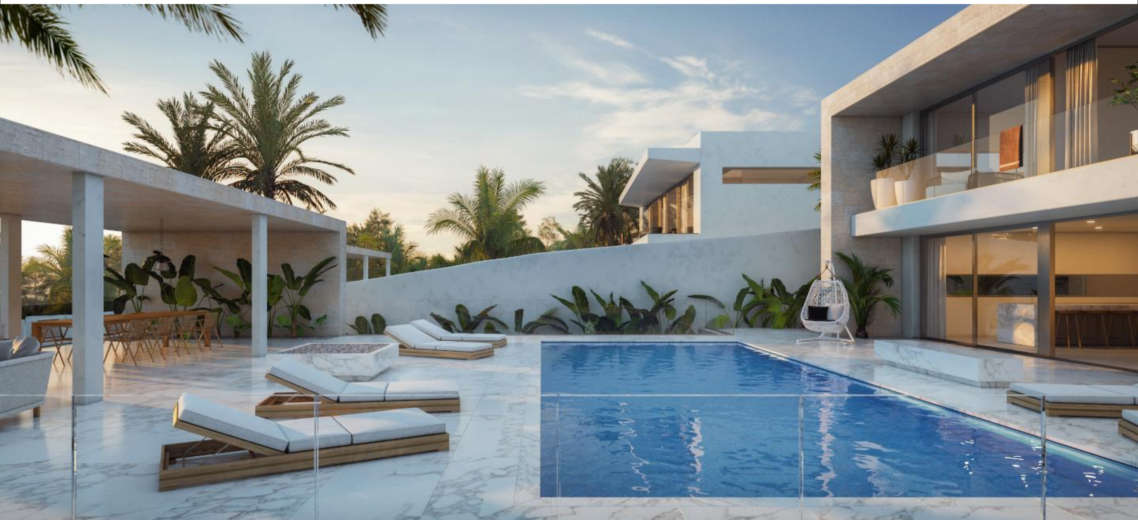
Villa de lujo con vista al mar en Tamanca - Ibiza